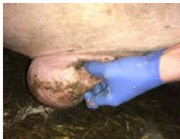
Status på såret 6 dage senere