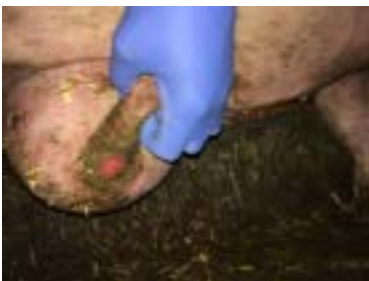
Sår på broksæk dag 1